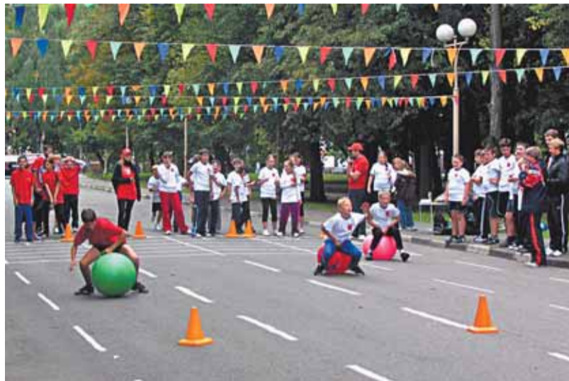
Досуговая и социально-воспитательная работа с населением по месту жительства

Переданные муниципалитету безвозмездное пользование нежилые помещения, по результатам проведенного конкурса программ по закреплению за некоммерческими организациями (НКО) нежилых помещений, предназначенных для ведения работы с населением по месту жительства, были закреплены за досуговыми центрами АНО «Фантазия» и АНО ДЭЦ «ОКО» с заключением договоров социального заказа (АНО «Фантазия» — помещения по адресам: ул. Л. Чайкиной, д. 4, корп. 1; Шибашевский пр., д. 5; ул. С. Вургуна, д. 1; АНО ДЭЦ «ОКО» — помещение по адресу: ул. 8 Марта, д. 9).